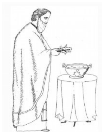
Το νερό με τις ευχές της Εκκλησίας γίνεται Αγιασμός!

Τα Θεοφάνια είναι ο Μέγας Αγιασμός. Ο ιερέας λέει: « Και αγιάσον το ύδωρ τούτο. » Επίσης λέει και διάφορες ευχές. Την 1η κάθε μήνα γίνεται πάλι αγιασμός. Είναι ο αγιασμός που φυλάμε δίπλα στο εικονοστάσι. Με αυτό μας ραντίζει ο ιερέας στην αρχή κάθε μήνα, στην αρχή της σχολικής χρονιάς και σε κάθε καινούριο ξεκίνημα στη ζωή μας. Αγιασμοί γίνονται στην Εκκλησία, αλλά και στα σπίτια των χριστιανών. Αγιασμό κάνουμε και στο σχολείο: ο ιερέας κρατώντας ένα κλωνάρι βασιλικό, ραντίζει όλους τους παρευρισκόμενους με το νερό του αγιασμού και δίνει στον καθένα μια ευχή.